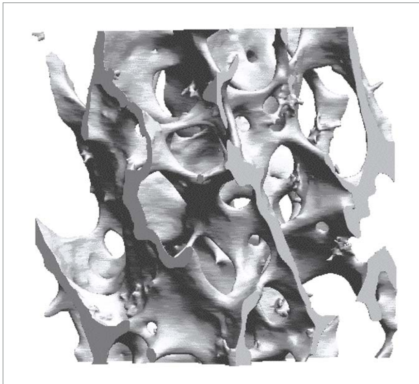
Image tri-dimensionnelle d'os trabéculaire de tête fémorale humaine par micro-tomographie synchrotron chez un sujet ostéoporotique avec une taille de voxel de 10,1 µm.

Contact : Jean-Pierre Gex Tél. 01 42 79 51 10 gex@ecrin.asso.fr