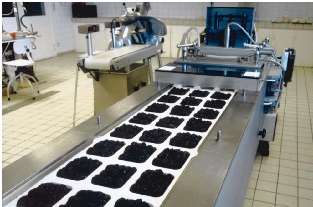
Usine de conditionnement de pruneaux.

Contact : Véronique Thierry-Mieg Tél. 01 42 79 51 01 thierry-mieg@ecrin.asso.fr